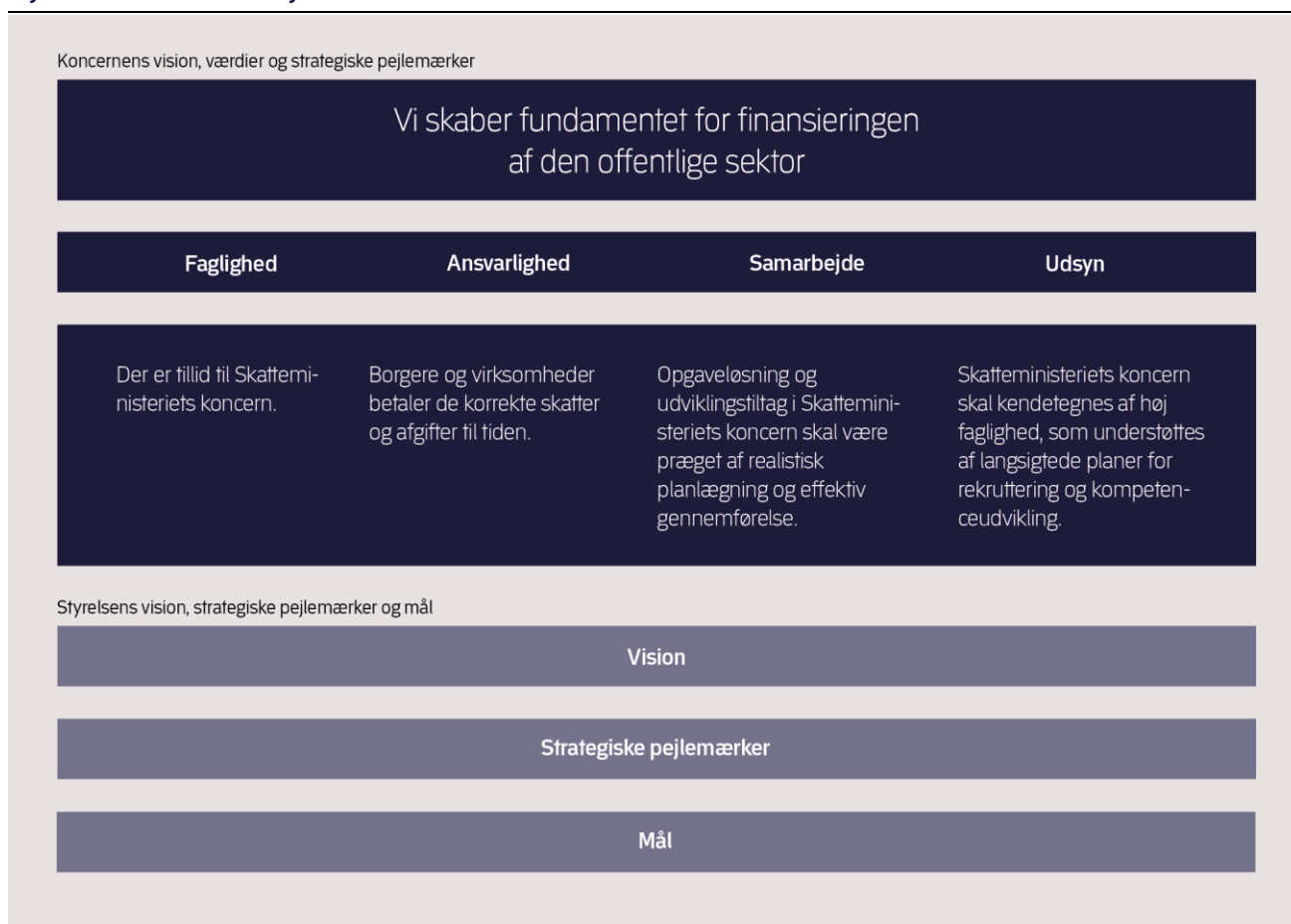
Figur 1. Koncernfælles strategisk ramme

Skatteministeriets koncernfælles strategiske ramme udgør et fælles fundament for koncernen og giver samtidigt et overblik over, hvilke elementer der indgår i den strategiske mål- og resultatstyring, jf. figur 1.